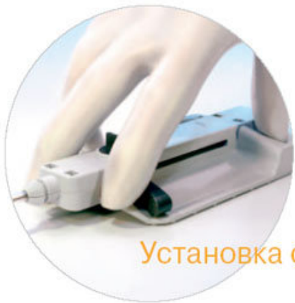
Установка одной рукой

Исследование ARСНеЯ. Комбинированная конечная точка. В исследовании ARСНеЯ риск инсульта снизился на 34%